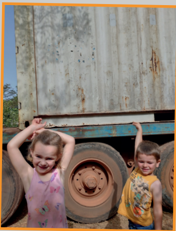
Aankomst container. De stickers zitten er nog op!