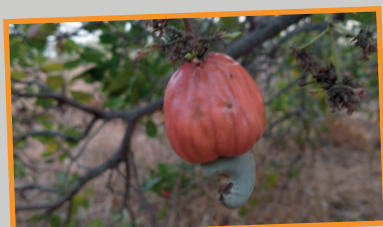
Zo groeit de cashewnoot