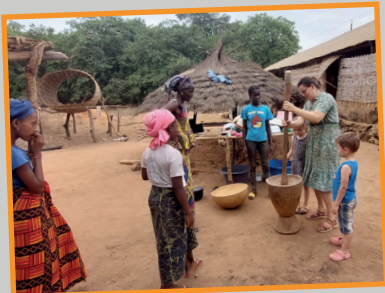
Relaties leggen met de vrouwen van een moslimfamilie.