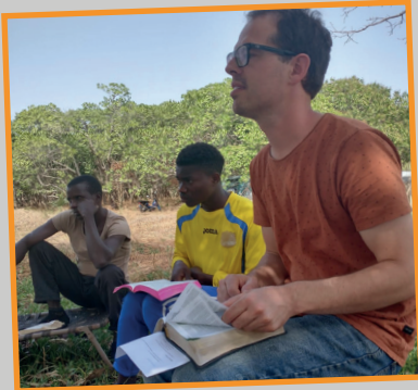
Bijbelstudie tijdens kamp.