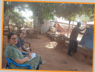
Taalles onder de mangoboom