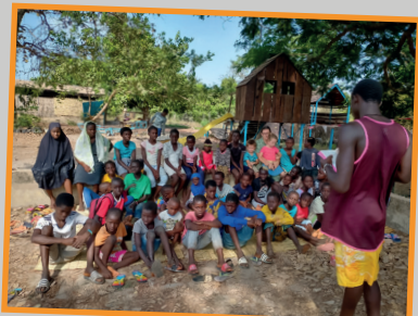
Samen een Bijbeltekst leren op de kinderclub