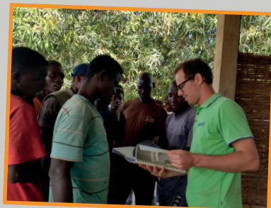
Samenwerken met de lokale bevolking. Het beantwoorden van vragen in de timmerwerkplaats.