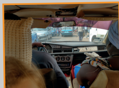
In de taxi met voorin de kippen.